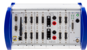
imc CRONOScompact Tragegehäuse